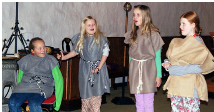
Innøving av dramastykke til søndagens preken.

Den siste helgen i januar deltok en liten flokk på «Tårnagenthelg» i Berg kirke, som innebærer en hel lørdag med solid detektivarbeid før mysteriene avsløres på gudstjenesten dagen etter. Dagen begynte med at agentene møtte opp i kirken, oppgav sitt hemmelige passord og fikk agentbevis. Etter hvert ble de gjort kjent med kirkens rom ved å løse en rebus hvor et hemmelig budskap var skjult forskjellige steder i skipet og koret. Etter å ha funnet en nøkkel i selveste lysgloben kunne de åpne en koffert forseglet med tykk kjetting. I