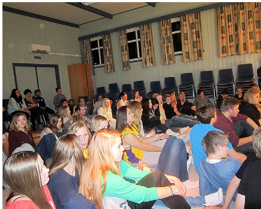
Konfirmantleir på Stenbekk. Konfirmanter fra Halden, Berg og Rokke samlet.

Uka før påske deltar konfirmantene på innsamlingsaksjon. De fleste konfirmantene