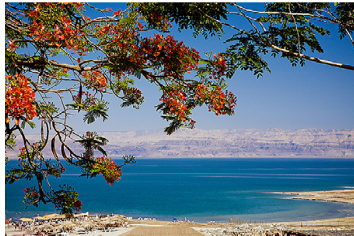
Utsikt over Dødehavet: «Landet, løftene og evangeliet» er tidligere publisert i «Ordet» og «Israel», sept. 2010, nr. 3 og gjengitt med forfatterens samtykke.

Det er både interessant og vanskelig å forstå at Gud taler til landet som til et levende vesen. Men dette vitner om at landet i seg selv er viktig for Gud, at det har sin egen verdi. Gud har et mål med landet slik som han har et mål med folket. Når Gud lover at landet skal bli bebodd av Israels folk, lover han at landet vil komme til sin rett. Det handler om Guds navn og ære. Men for at landet skal komme til sin rett, må folket komme til sin rett. Dette handler Esek. 36:16 om. Men denne delen av teksten handler først og fremst om Guds navn og ære. Folket har med sine synder gjort landet urent. Derfor jaget Gud dem bort blant folkene, (v. 16–19). Dette førte til at Guds navn ble krenket blant disse folkene, (v.20). Derfor må Gud gjøre noe for sitt navns skyld (v.20–21). Han manifesterer sin hellighet